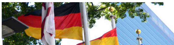
UN-Hauptquartier in New York

In den 70 Jahren ihres Bestehens haben sich die Vereinten Nationen (UN) stets um Frieden und ein besseres Zusammenleben auf der Welt bemüht. Florian Hahn machte deutlich, dass die Weltorganisation gerade in scheinbar aussichtslosen Situationen immer wieder Erfolge aufweisen kann.