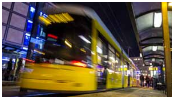
Die zusätzlichen Kompensationszahlungen des Bundes kommen insbesondere dem Öffentlichen Personennahverkehr zugute

Nach dem Gesetzentwurf wird der Bund den Ländern - wie bisher - aus seinem Haushalt im Jahr 2014 Beträge von rund 2,6 Milliarden Euro zur Verfügung stellen. Hintergrund ist die Föderalismusreform. Bund und Länder hatten sich 2005 in der Kommission zur Modernisierung der bundesstaatlichen Ordnung auf Verfassungsänderungen geeinigt, um Mischfinanzierungen zu reduzieren und die Möglichkeiten für Finanzhilfen des Bundes neu zu fassen. Wegen der ausfallenden investiven Mittel des Bundes wurde den Ländern eine