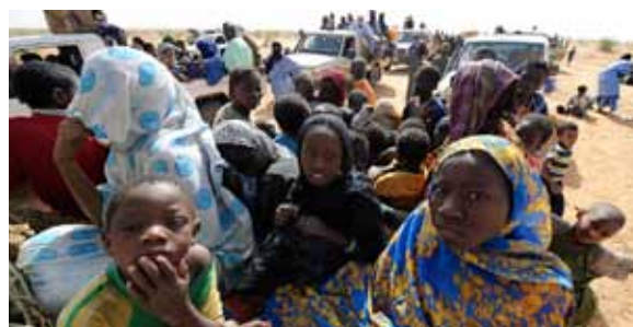
Malische Kinder im Flüchtlingscamp Fassala nahe der malischen Grenze in Mauretanien

Mit den Anträgen reagiert die Bundesregierung auf die verschärfte humanitäre Situation in Mali, die in Folge der im Januar 2012 ausgebrochenen Kämpfe zwischen Regierungseinheiten und den Tuareg-Rebellen entstanden ist. Der Staat Mali als Ganzes stand vor der Übernahme durch islamistische, intolerante Rebellengruppen. Diese hatten in den von ihnen eroberten Gebieten im Norden Malis bereits die Scharia in ihrer schärfsten Form eingeführt. Rund 450.000 Binnenflüchtlinge sind vor den vordringenden Islamisten geflohen und eine humanitäre Katastrophe hat sich angedeutet. In dieser Situation rief die malische Übergangsregierung am 10. Januar dieses Jahres Frankreich zu Hilfe. Durch den Einsatz der französischen Streitkräfte ist es gelungen, den Vormarsch der Re-