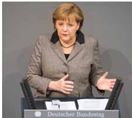
Bundeskanzlerin Dr. Angela Merkel am Donnerstag bei ihrer Regierungserklärung im Deutschen Bundestag

Die EU-Regierungschefs hatten sich Anfang Februar im zweiten Anlauf auf das EU-Budget für die Jahre 2014-2020 geeinigt und damit das Fundament für die Beratungen über die Mittel der EU in diesen Jahren gelegt. Merkel erklärte vor dem Bundestag, dass Deutschland alle Ziele erreicht habe. „Der Abschluss der Finanzplanungen schafft Planbarkeit und Sicherheit für alle“, betonte sie. Der Beschluss sieht eine Obergrenze des mittelfristigen Finanzrahmens von 960 Milliarden Euro vor und die EU-Mitgliedstaaten zahlen künftig ein Prozent des Bruttonationaleinkommens ein. Damit gebe es erstmals keinen weiteren „Aufwuchs“ der Ausgaben. Wenn alle EU-Staaten sparen müssten, dann müsse dies auch die EU tun, erklärte die Kanzlerin. Ein wichtiges Ziel der Bundesregierung bei den Verhandlungen war es, dass die Mittel der EU in Zukunft effektiver eingesetzt